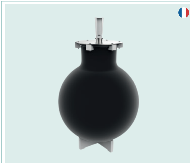
LA ROBE DE PROTECTION en matière lycra