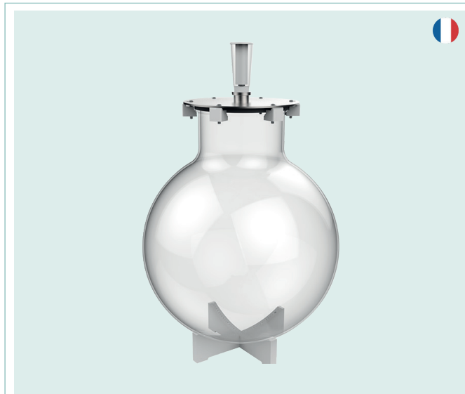
CROISILLON en téflon alimentaire